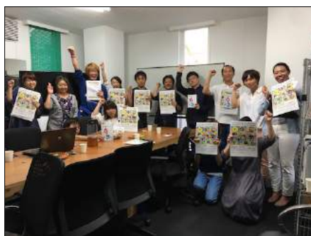
『ベップ・アート・マンスをつくろう会』の様子

『ベップ・アート・ナビ』とは、『ベップ・アート・マンス』期間外にご利用いただけるプログラム企画者限定のサービスです。2018年11月26日(月)から翌年のプログラム募集開始日までの間、『ベップ・アート・マンス』の公式Webサイト上に、別府市内で開催されるイベントの情報が掲載できます。詳細は事務局より改めてお知らせいたします。