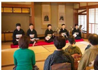
趣のある近代建築の建物のお座敷で、三味線の演奏会。

歌や楽器の発表会から、プロのミュージシャンのコンサートまで、多彩な音楽イベントや映画の上映会が開催されました。