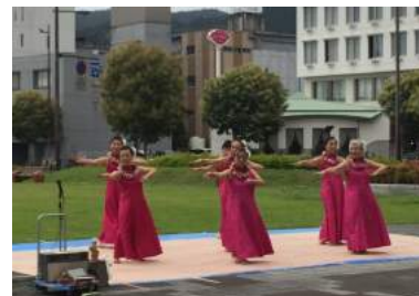
北浜公園でおこなわれたフラダンス。