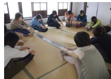
築100年の長屋でおこなわれた、ヨガ体験教室。