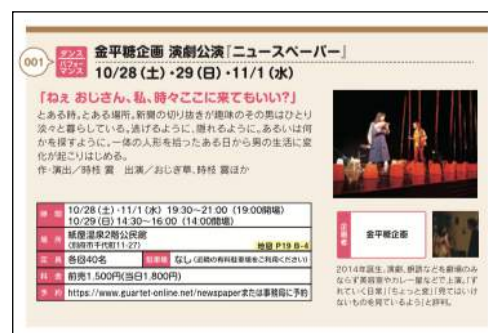
登録プログラム紹介記事(イメージ)