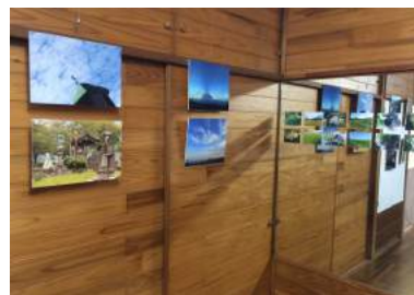
趣味で撮りためた写真を喫茶店で展示。