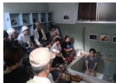
使われなくなった共同浴場での展覧会にあわせたトーク。