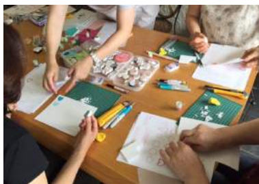
カフェの一角でおこなわれた、消しゴムハンコ制作体験。

子どもから大人まで、多くの人々が参加・体験できるワークショップが開催されました。