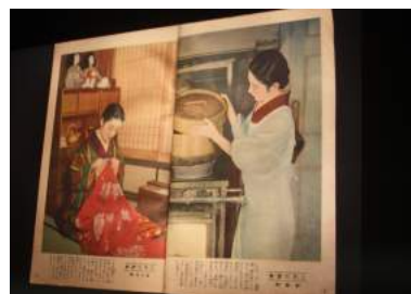
国民学校時代の教科書のスライド上映と、懐メロの鑑賞会。