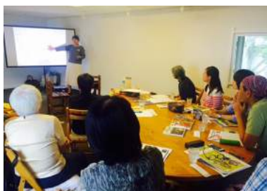
学生主催による、ブータンの衣食住について紹介するトーク。

学生やNPO法人など、さまざまな市民の方がシンポジウムや講座などのトークイベントを開催しました。