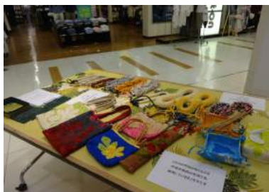
百貨店でおこなわれたハワイアンキルトの展示。

写真、書道、絵画、彫刻、現代アートなど、幅広いジャンルの展覧会が開催されました。