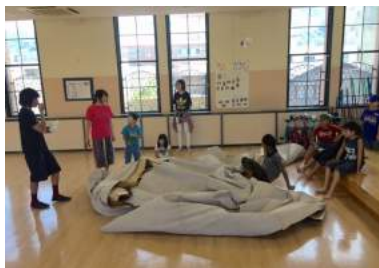
児童館でおこなわれたパフォーマンスイベント。

公民館やホール、駅構内や公園など、さまざまな場所がパフォーマンスの舞台になりました。